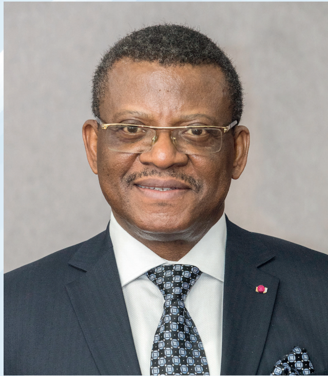
Chief Dr Joseph DION NGUTE, Premier Ministre, Chef du Gouvernement