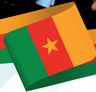
S.E. Paul BIYA, Président de la République du Cameroun