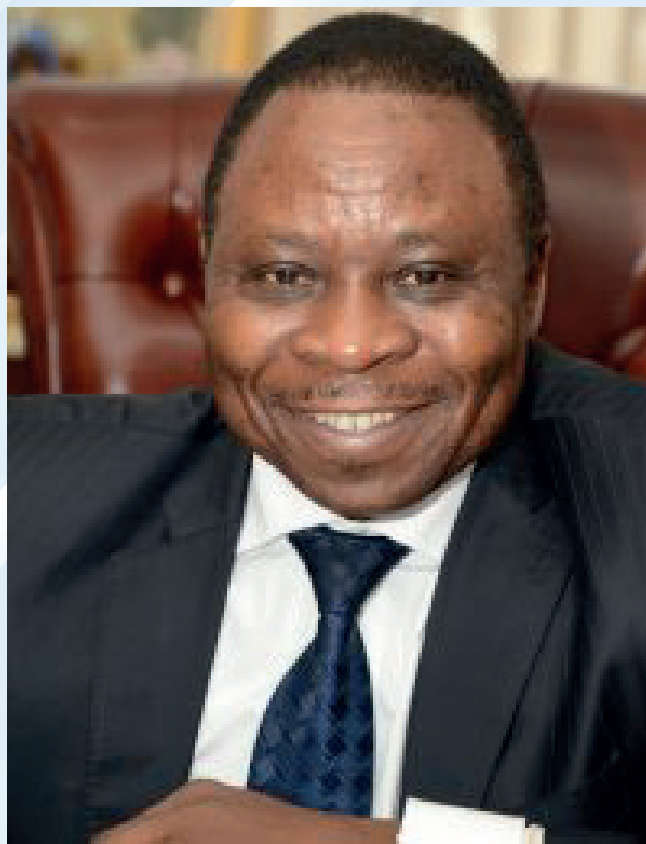
Gaston ELOUNDOU ESSOMBA, Ministre de l'Eau et de l'Énergie